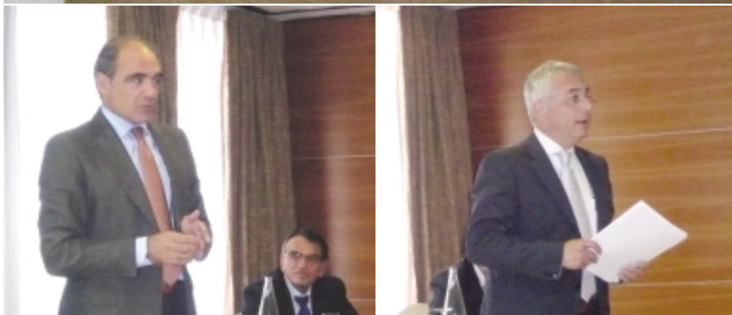
Diferentes momentos de la reunión.

4) La normativa europea no es de obligado cumplimiento por el momento. Para que se publique cuanto antes en el BOE es necesario el trabajo y la colaboración de todos. Así estas normas, que ya están hechas y reducen falsas alarmas en otros países europeos, se deberían incluir en la legislación nacional.