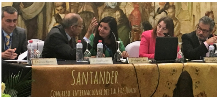
Uno de los momentos del congreso