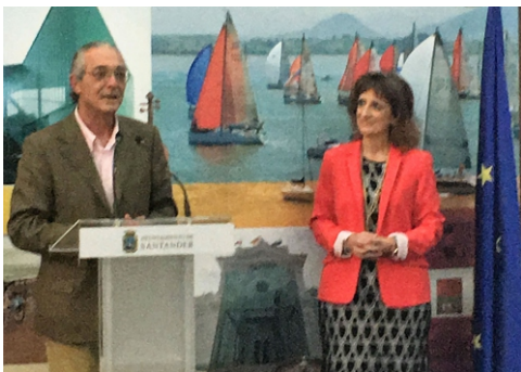
Uno de los momentos del congreso

La conferencia inaugural corrió a cargo de Jorge Ferrer Moltó. Con el título "Protección de datos, el área gris del sector", invitó a los asistentes a cumplir con la ley, ya que si no, dijo, el coste sería mayor.